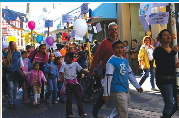
Veranstaltung zum Weltkindertag in Koblenz: Wir waren mit vielen Kindern dabei