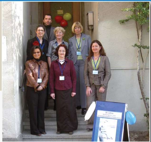
30 Jahre Beratung. Die Mitarbeiter stellten am Tag der offenen Tür ihre Arbeit vor

Durch den regen Kontakt zu verschiedenen Schulen in Koblenz (Gymnasien und Berufsbildende Schulen) wird versucht effektive Öffentlichkeitsarbeit zu leisten. Die Schulen laden regelmäßig eine Mitarbeiterin zu dem Thema „Schwangerschaftskonflikt“ ein oder kommen mit Schülern auch in die Beratungsstelle.