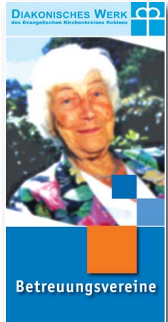
Infobroschüre über Veranstaltungen unserer Betreuungsvereine

Betreuungsverein im Diakonischen Werk des Evangelischen Kirchenkreises Koblenz Koblenz