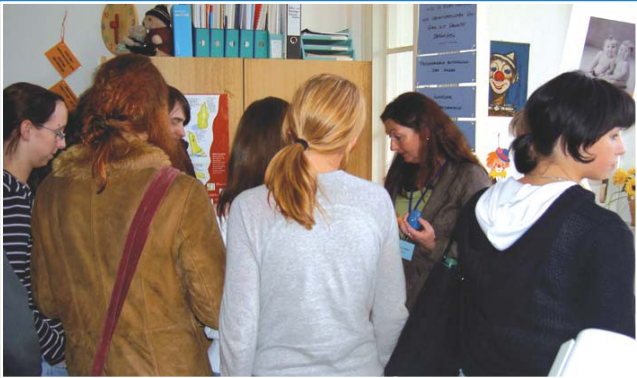
Informationsveranstaltungen für junge Frauen