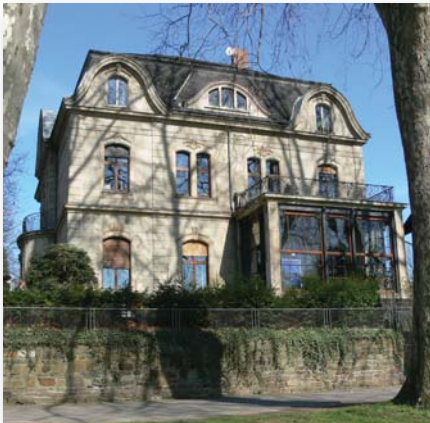
Geschäftsstelle Diakonisches Werk Koblenz